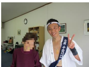
神輿担ぎの若手と記念写真。出町茶論のスタッフでもあります。

上京の氏神の上御霊神社のお祭りで神輿巡行が5月18日にあり、出町茶論前の寺町通を3基の神輿が通り、ご利用者の皆さんと見学しました。御霊祭は、今から約1150年前に神泉苑で行われた御霊会が起源とされている京都でも歴史のあるお祭りです。