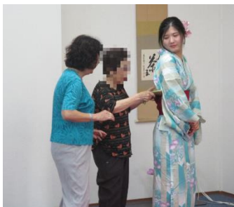
中国人留学生に浴衣着付け

訪日外国人や留学生に日本文化のおもてなしをシニアが行う「第4回京都シニアおもてなしクラブ」を行いました。今回は、学生が中心となり企画・運営を行い、ご利用者には着付けの応援をお願いしました。浴衣を着て、散策し帰ってからお茶、書道を楽しんでもらいました。高齢者と若者が、それぞれの役割を分担します。これからも高齢者の活躍する場を広げるとともに、多世代交流を進めていきます。