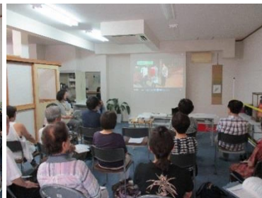
7月14日（土）認知症サポーター養成講座