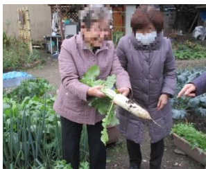
どのような料理に？