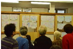
出来上がった絵を鑑賞しました。