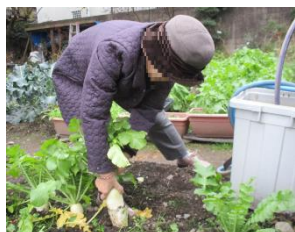
ダイコンを引き抜く！ 日常生活では味わえない快感！