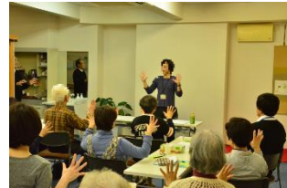
上京区地域介護予防推進センターの介護予防指導員さんのアイスブレイク