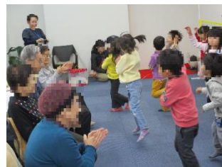
大きな声で歌い、所狭しと踊りの披露