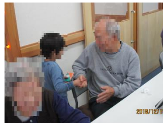
クリスマスカードのプレゼント

核家族化が進み、高齢夫婦、高齢独居世帯が増え続ける現代社会で、縦の年代の繋がりが希薄になっています。今回のようなケースだけではなく、様々な形態で多世代の繋がりを増やす機会を設けて行きたいと思います。