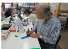
短冊に心を込めて願い事

毎年恒例の出町櫛形商店街の七夕祭りが来ましたが、ただ、今年はコロナの影響で地域の皆さんが楽しみにされている屋台は、昨年引き続き中止となりましたが、七夕飾りは商店街をにぎやかに飾っています。出町茶論もご利用者の皆さんの願いごとを書いた短冊を笹に取り付け参加しました。