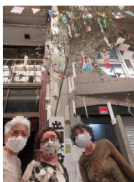
出町茶論の笹飾り