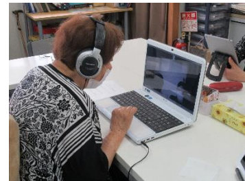
少し聞き取りにくかったのでヘッドホンを使用しました