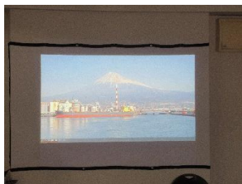
静岡田子の浦からの富士山

ユーチューブから観光地のLIVEを見て旅行気分を味わっていただいています。中には以前に旅行した場所を懐かしく思い出される方もいます。