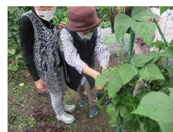
玉ねぎ、キュウリ、ピーマン、さやえんどう、メークイン 収穫