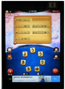
文字を繋ぎ言葉を作る