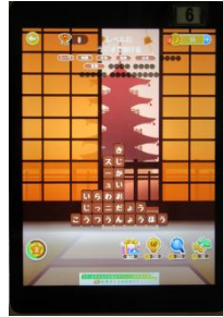
キーワードから言葉探し